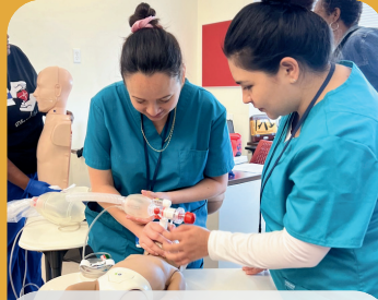
AUXILIAR DE ENFERMERÍA